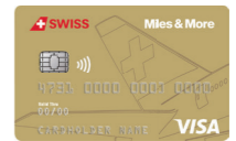
SWISS Miles & More Visa Gold