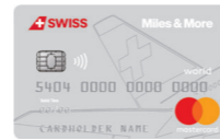
SWISS Miles & More World Mastercard® Standard